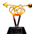
Campanha de comunicação BtoB - 2008