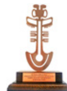
XIII Premio AMAUTA at Marketing Directo e Interactivo