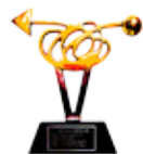
O melhor dos melhores em CRM/DBM - 2008